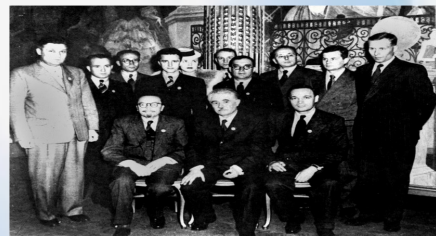
Делегація України (УРСР) на установчій конференції ООН у Сан-Франциско (1945 рік). Зліва направо (сидять): Володимир Палладін, Дмитро Мануїльський, Іван Сенін.

ООН. У 1971 році Генеральна Асамблея ООН прийняла резолюцію, в якій рекомендувала державам-членам відзначати цей день як державне свято.